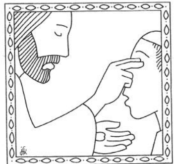
Fecce del fango con la saliva e spalmò il fango sugli occhi del cieco. Giovanni 9,6

Condussero dai farisei quello che era stato cieco: era un sabato, il giorno in cui Gesù aveva fatto del fango e gli aveva aperto gli occhi. Anche i farisei dunque gli chiesero di nuovo come aveva acquistato la vista. Ed egli disse loro: «Mi ha messo del fango sugli occhi, mi sono lavato e ci vedo». Allora alcuni dei farisei dicevano: «Quest'uomo non viene da Dio, perché non osserva il sabato». Altri invece dicevano: «Come può un peccatore compiere segni di questo genere?». E c'era dissenso tra loro.