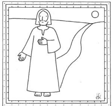
«Io sono la via» Giovanni 14,6

Gli disse Filippo: «Signore, mostraci il Padre e ci basta». Gli rispose Gesù: «Da tanto tempo sono con voi e tu non mi hai conosciuto, Filippo? Chi ha visto me, ha visto il Padre. Come puoi tu dire: “Mostraci il Padre”? Non credi che io sono nel Padre e il Padre è in me? Le parole che io vi dico, non le dico da me stesso; ma il Padre, che rimane in me, compie le sue opere.