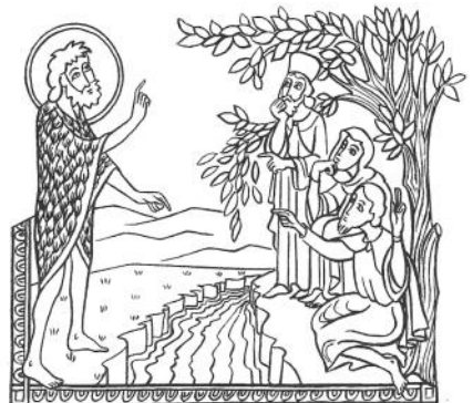
Il suo nome era Giovanni. Giovanni 1,6

Questa è la testimonianza di Giovanni, quando i Giudei gli inviarono da Gerusalemme sacerdoti e leviti a interrogarlo: «Tu, chi sei?». Egli confessò e non negò. Confessò: «Io non sono il Cristo». Allora gli chiesero: «Chi sei, dunque? Sei tu Elia?». «Non lo sono», disse. «Sei tu il profeta?». «No», rispose. Gli dissero allora: «Chi sei? Perché possiamo dare una risposta a coloro che ci hanno mandato. Che cosa dici di te stesso?». Rispose: «Io sono voce di uno che grida nel deserto: Rendete diritta la via del Signore, come disse il profeta Isaia».